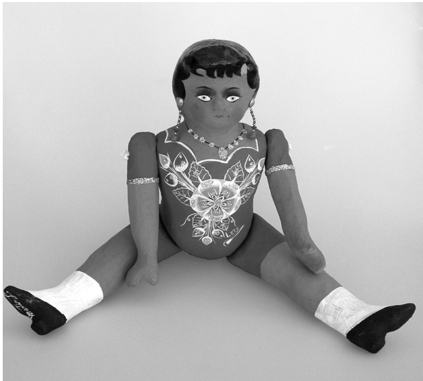
Muñeca de cartón. Juguete elaborado por Martín Lemus. Celaya, Gto.

(Estatuto Legal del Gremio) entre los artesanos de la seda ( ibidem ).