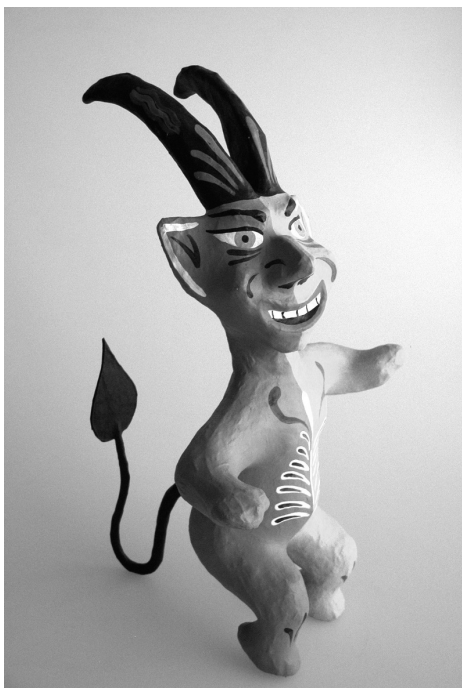
Judas de cartón. Juguete elaborado por Mauricio Hernández Colmenero. Guanajuato, Gto.

una tríada que permite crear objetos y formas convertidos en juguetes, los cuales adoptan múltiples manifestaciones y modalidades.